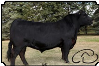
SAV PUREBRED 4846 SAV PIONEER 7301 X SAV BLACKCAP MAY 8051