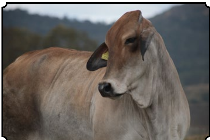
CABR LA CALLAS 2053