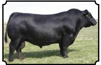
SAV NET WORTH 4200 SAV 8180 TRAVELER 004 X SAV MAY 2410