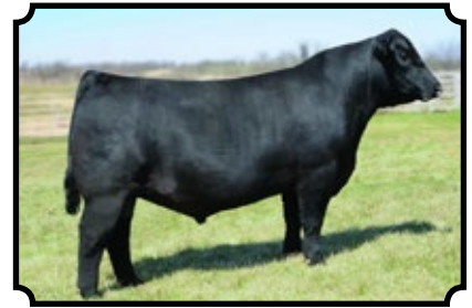
SAV BRILLIANCE 8077 SAV BISMARCK 5682 X SAV BLACKCAP MAY 5270