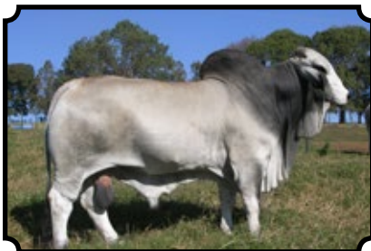
CABR MR FERRARI 1469

JDH WESTIN MANSO 80/1 X JDH MS CANDYCE MANSO