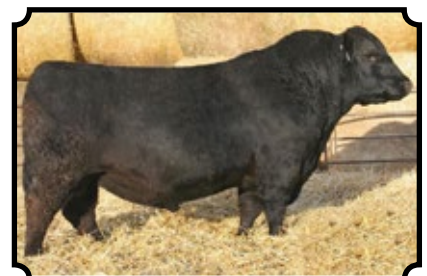
SINCLAIR FORTUNATE SON SINCLAIR EMULATE 7XT28 X SINCLAIR BLACKBIRD 2P8 7079