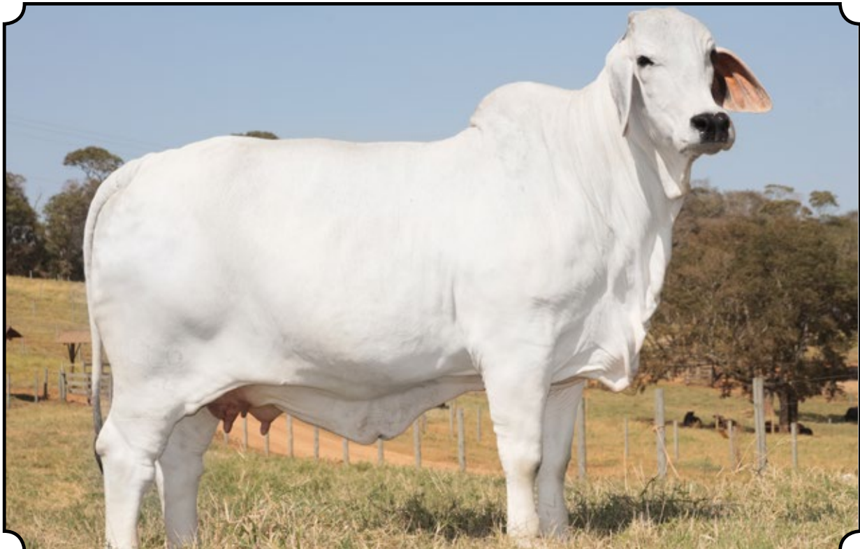
MISS 1504 PORTOBELLO

Segue prenhe do CABR Jalisco, com previsão de parto para 11/10/2017.