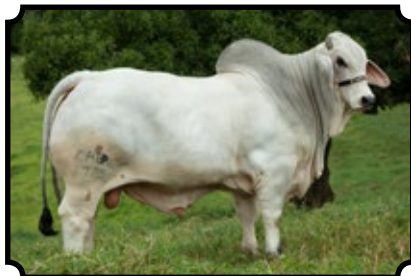
CABR MR ILUSTRE 1729

JDH WOODSON MANSO 206/7 X JDH LADY GEMMA MANSO 395/6