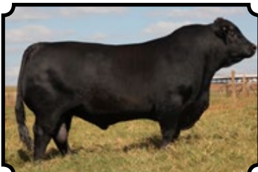
GRANDE CAMPEÃO - AVARÉ 2017 50% À VENDA NESSE LEILÃO