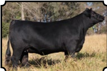
CAMPEÃ NOVIHA MENOR - LONDRINA 2017 PARCERIA COM A FAZENDA SÃO MARCO PWM RELIQUIA 1720 CREDITO