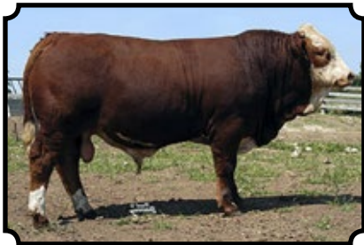
BAR 5 SA HERO 823M KYKSO HAPED X RU-DEV PEPPY