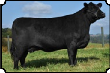
CAMPEÃ NOVIHA NACIONAL 2013 PROPRIEDADE VPJ AGROPECUÁRIA PWM TYPE 2009 HITTER 02816