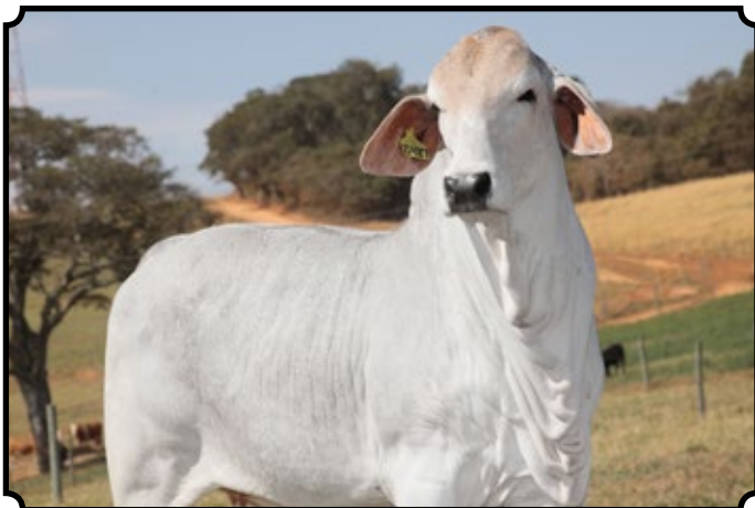
CABR ORIANA 2487