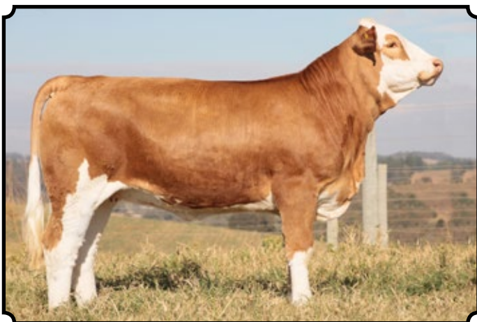
PWM TARLA AS

Está com 2 lindas bezerras ao pé, filhas de PWM Palemon, nascidas em 18/06/2017.