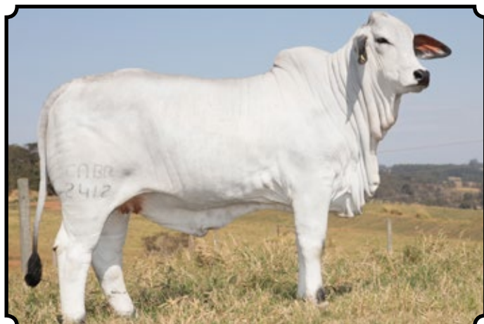
CABR ORFA 2412

Inseminada em 11/07/2017, por CABR Mr Leblon.