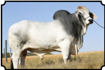
CABR IOTIN 1769

JDH MR MOSLEY MANSO 368/1 X CABR DHIFALLA 899