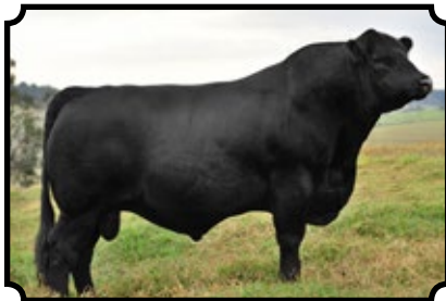
PWM NIKO SAV BISMARCK 5682 X RECONQUISTA 734 ILHA YAN. ROB