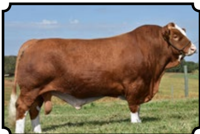
PWM NETUNO AS BAR 5 SA PIONEER 439L X PWM FANTASTYK AS