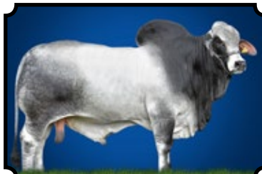
GRANDE CAMPEÃO - EXPOZEBU 2017 50% À VENDA NESSE LEILÃO