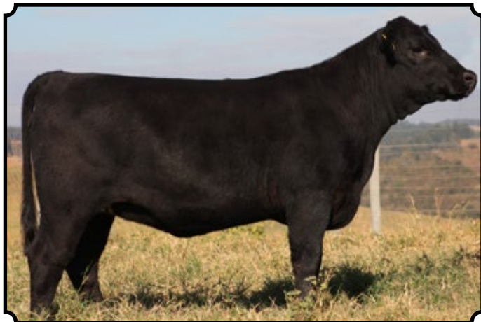
PWM TAMARA 2182 RADIOATIVA