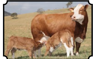
GRANDE CAMPEÃ NACIONAL 2017 PARCERIA COM A SAFRON AGROPECUÁRIA