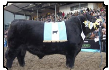
TRES MARIAS 6301 ZORZAL TRES M. 5887 HORNERO X TRES M. 4850 WIND EXT