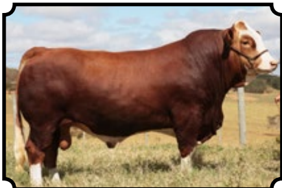
LGPM SALVATORE PWM OSTER AS X LGPM PRADA