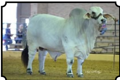
JDH LAYTON DE MANSO 701/8

JDH DAKOTA MANSO 599 X JDH LADY REM MANSO 7