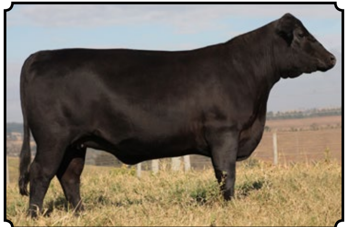
PWM TRAP 2026 B MAID

Inseminada em 01/08/2017, do reprodutor PWM Rei 1560 Lider.