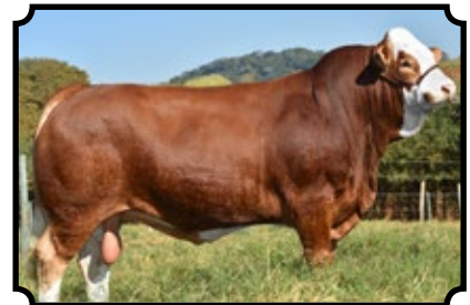
PWM PALEMÓN AS SIMLEE HAVAN X RU-DEV SYBIL