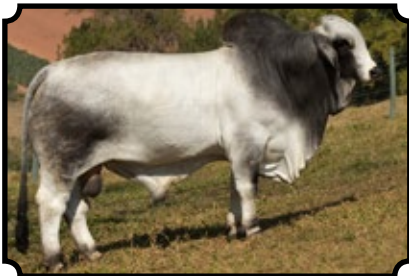
CABR MR LEBLON 2014

JDH SIR LAWFORD MANSO 616/6 X JDH LADY VERA MANSO 53/1