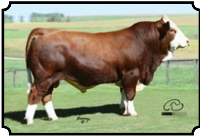
BAR 5 SA BISMARCK 420C LEEUPOORT BRITS X RAAP N SKRAAP MARDA