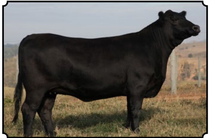
PWM TRIVIAL 2022 ENCHANTRESS

Inseminada, em 15/08/2017, do reprodutor SAV Resource 1441.