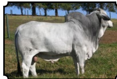
CABR MR GALUR 1700

JDH MR WOODMAN MANSO 578/6 X JDH AURORETTE MANSO 934 JDH SIR LAWFORD MANSO 616/6 X JDH LADY VADO MANSO 751/5