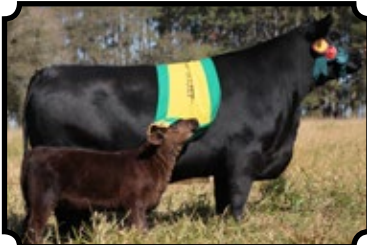
GRANDE CAMPEÃ - AVARÉ 2017 50% À VENDA NESSE LEILÃO