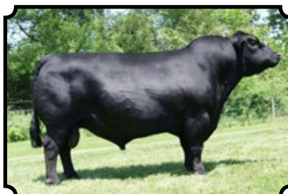
SINCLAIR ENTREPRENEUR 8R101 RR RITO 707 X N BAR KINCHTRY BEAUTY Z1925