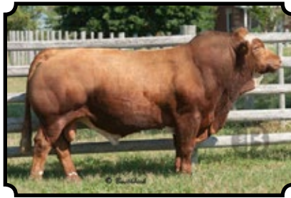
BAR 5 SA BIGOLO 402A LEEUPOORT BRITS X RAAP N SKRAAPMARDA