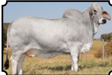
RESERVADA GRANDE CAMPEÃ NACIONAL 50% À VENDA NESSE LEILÃO