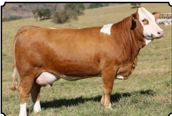
PWM RUSSIAN CHERRIE AS

Parida de macho, em 26/07/2017, do PWM Palemon AS.