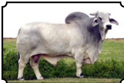
JDH MR AMOS MANSO 568/6

JDH SIR LIBERTY MANSO X JDH LADY PRATTVILLE