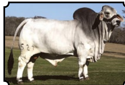
JDH WELLINGTON MANSO 527/1

JDH MADISON DE MANSO 737/4 X JDH NATALIA DE MANSO 605/4