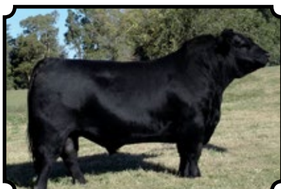
TRES MARIAS 8155 CANDELERO DON JOSE 176 LIDER 6204 "MAXI" X TRES MARIAS 7358 CUMELÉN