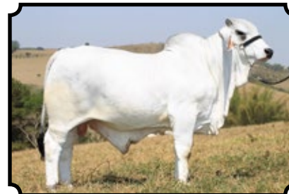
CABR MR GUNTER 1612

JDH FRESNO MANSO 19/6 X JDH MISS DECATUR MANSO 73/6