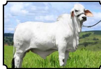
CABR JALISCO 1841

JDH MR AMOS MANSO 568/6 X CABR DHIFALLA 899