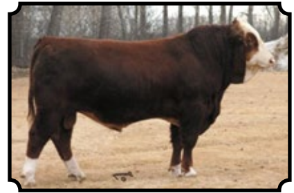
BAR 5 SA ELTORRO 814S BAR 5 P SA EXPERT 826M X RU-DEV CERAMIA