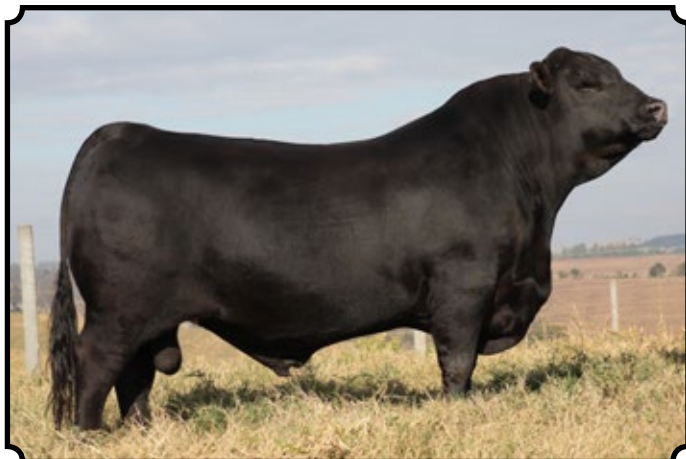
PWM SUN TEICB1870 FEDERAL