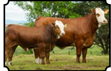
GRANDE CAMPEÃ - SHOW DA RAÇA 2014 PARCERIA COM A SAFRON AGROPECUÁRIA