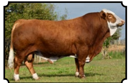
PWM MIG AS BAR 5 SA HERO 823M X BAR 5 SA ELLA 435N