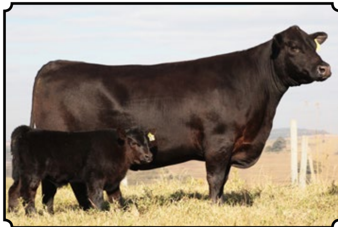
BIGUÁ 5708 ZORZAL

Linda bezerra, filha do Grande Campeão da Beef Expo/2016, PWM Rei 1560 Lider, destaque da bateria da CRV Lagoa, que combina o sangue do Maxi e da fantástica Tres Marias 8004 Morocho, com a PWM Radiotiva, fêmea reserva da Casa Branca, filha direta do LCC Saugahatchee 300C.