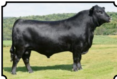
SAV TEXTBOOK 5115 AAR TEN X 7008 SA X SAV MADAME PRIDE 3304