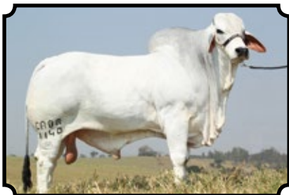
CABR MR ESPIRIT 1140

JDH WELLINGTON MANSO 527/1 X CABR DHIFALLA 899