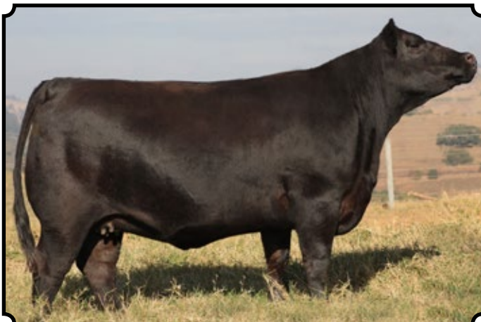
PWM REFINADA 1731 CANDELERO

Segue prenhe do reprodutor SAV Brilliance 8077, com previsão de parto para 24/11/2017.