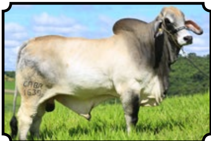
CABR MR GARTZ 1639

JDH MADISON MANSO 737/4 X JDH MISS SUZANNE MANSO 745/6