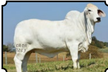
GRANDE CAMPEÃ NACIONAL EXPOZEBU 2016 E EXPOBRAHMAN 2016 PARCERIA COM DOUGLAS ULHOA SAAT