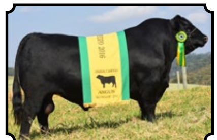
PWM REI TEICB 1560 LIDER DON JOSE 176 LIDER 6204 TE X TRES MARIAS 8004 "MOROCHA"