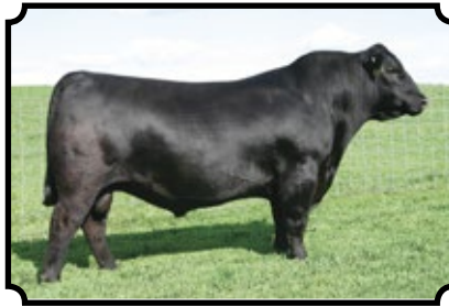
SAV BISMARCK 5682 GAR GRID MAKER X SAV ABIGALE 0451