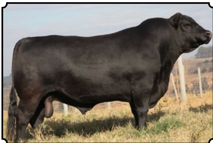
PWM SANTIAGO TEICB1821 ZORZAL

Touro de central! Grande Campeão, em Avaré/2017. Filho do Candelerio, touro número 1 do sumário do Promébo, com a Três Marias 8338, uma filha do Heavy Hitter com a 4850, simplesmente a mãe do Zorzal.