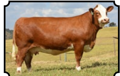
GRANDE CAMPEÃ NACIONAL 2016 PARCERIA COM SIMENTAL XAPETUBA