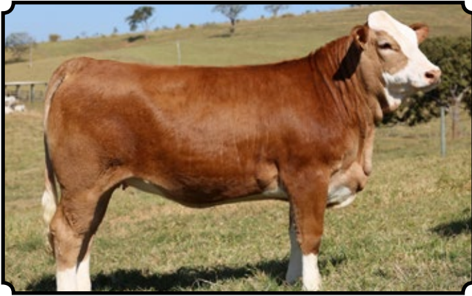
PWM TANGARA AB