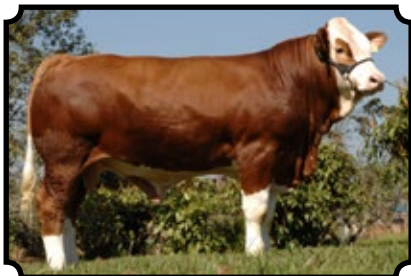
PWM INTERLAGOS AS BAR 5 SA PIONEER 439L X BHR KAMBIRT SA L057E