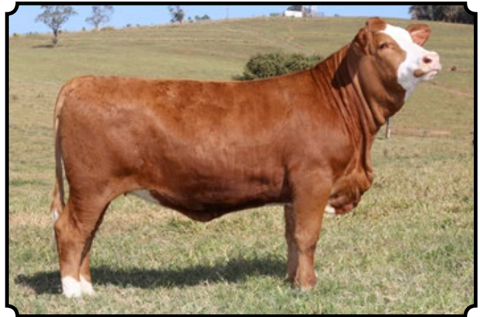
PWM TIGRESA AS

Inseminada, no dia 01/08/2017, pelo líder do sumário PWM Mig AS.