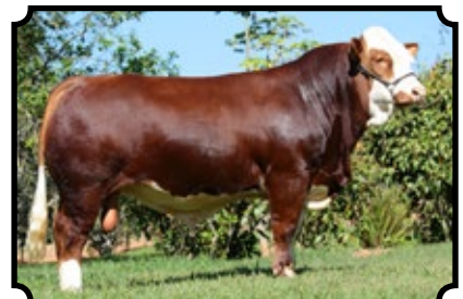
PWM IMPORT AS BHR DOORN G629E X BHR YANAMARI M240E