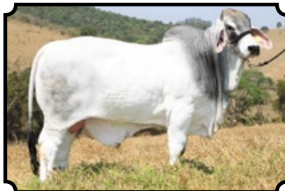
CABR MR GROVE 1596

JDH MADISON MANSO 737/4 X JDH MISS SUZANNE MANSO 745/6