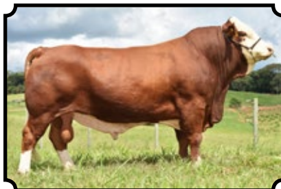
PWM OSTER AS BAR 5 SA EVAN 440L X SS PRISSEY