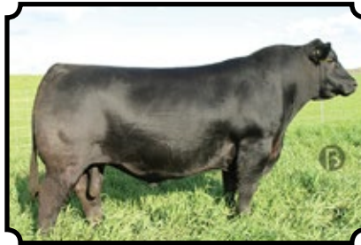
SAV HARVESTOR 0338 SAV HERITAGE 6295 X SAV EMBLYNETTE 7749