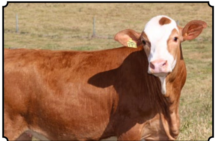
PWM TALANA AS

Sua mãe foi Campeã Nacional, filha de PWM Federal Massie e PWM Miragem AS, que é Doorn com Bar 5 Sissy Power. Pedigree que mescla força com maternal.