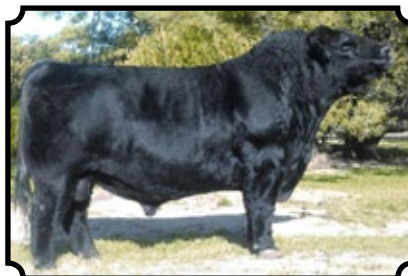
DON JOSE 176 LIDER 6204 "MAXI" OCC HEADLINER 6611 X TRES MARIAS 6204 HORNERO 5314