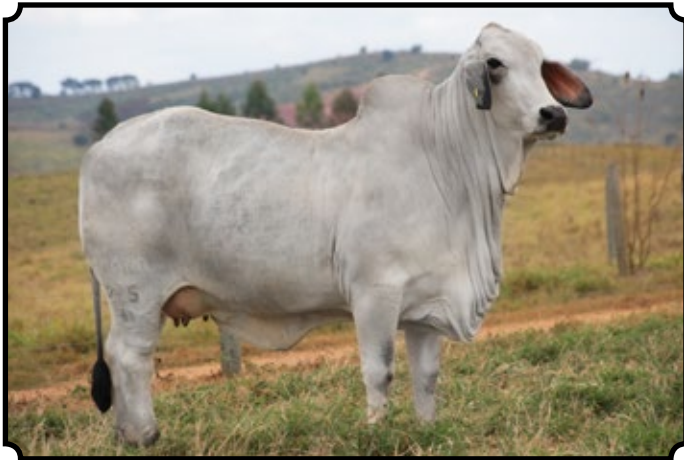
CABR MATREIRA 2250

LOTE 431 CABR MATREIRA 2250 RG: CABR 2250 | NASC.: 20/08/2014