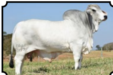
GRANDE CAMPEÃO - EXPOBRAHMAN 2016 PARCERIA COM EVERALDO SILVA