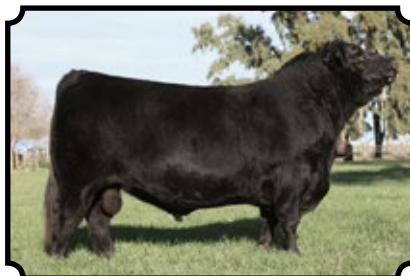
TRES MARIAS 9257 FEDERAL SAV HEAVY HITTER 6347 X TRES M. 6990 HORNERO 6116