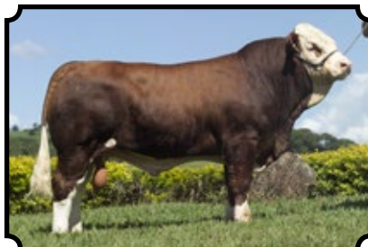
PWM ERBAINO AS KYKSO KAINO X KYKSO ERBA