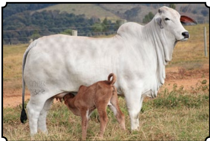
CABR NEW BAMBINA 2322

Segue prenhe do CABR Jalisco 1841, com parto previsto para 18/09/2017.