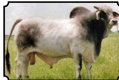
JDH KARU MANSO 800

CABR MR FERRARI 1469 X CABR LADY ELBA 1004