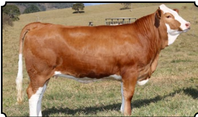
PWM TRINIDAD AS

Novilha, filha de pais da última importação da África do Sul. Genética inédita à venda! Terá seu parto aos 23 meses. Esta prenhe do PWM Oster AS, com previsão de parto para 22/03/2018.