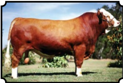
BAR 5 SA PIONEER 439L SALERIKA EVAN X AI-AI SISKA