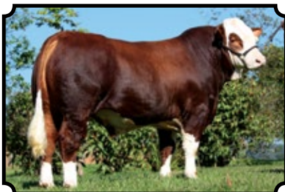
PWM JANUS AS PWM ERHAN AS X BHR KAMARIA SA M208E