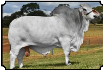
CABR JACKPOT 1870

JDH MR MOSLEY MANSO 368/1 X CABR DHIFALLA 899