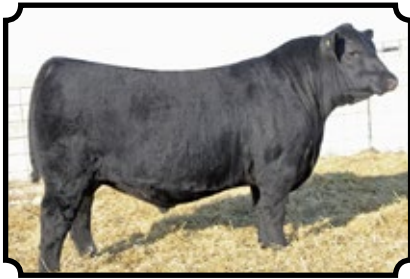
SAV ANGUS VALLEY 1867 SAV IRON MOUNTAIN 8066 X SAV MAY 2397