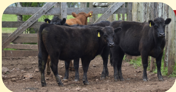
Fêmeas 1 ano PO